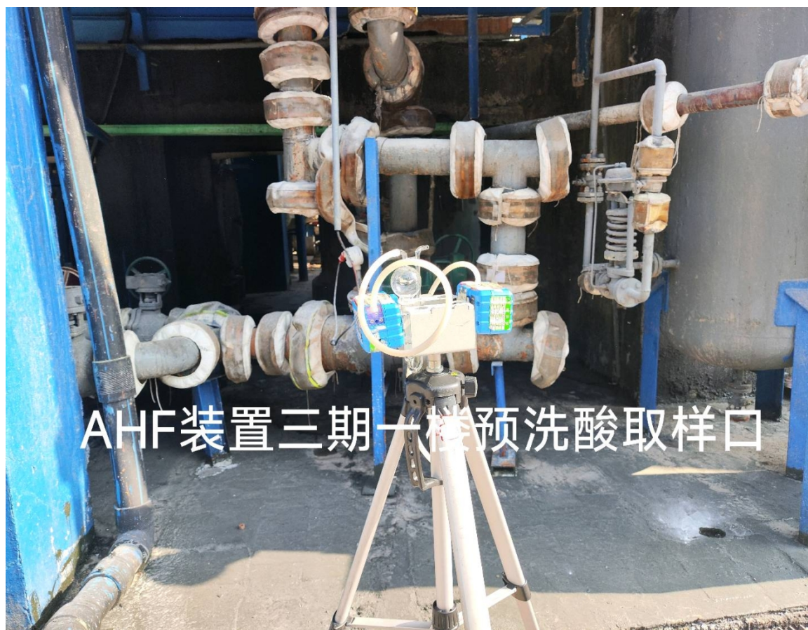
AHF装置三期一楼预洗酸取样口